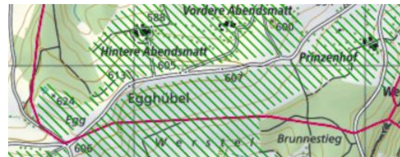
Vorranggebiet Landschaft im Bereich „Egghübel / Räng“

Im Zusammenhang mit der Mutation der Zonenvorschriften Landschaft steht insbesondere das Vorranggebiet Landschaft aus dem kantonalen Richtplan vom 08. September 2010 im Vordergrund. Das Gebiet „Egghübel / Räng“ liegt im Vorranggebiet Landschaft, welches grundsätzlich von Bauten und Anlagen freizuhalten ist.