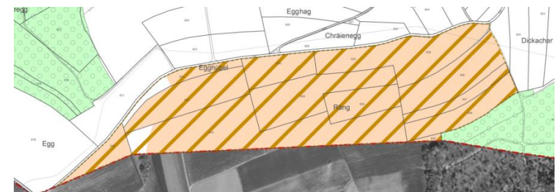
Mutation Zonenplan Landschaft

Die Argumentationen der Gemeinde bezüglich „Nicht-Festlegung“ des Gebiets „Egghübel / Räng“ als Landschaftsschutzzone wurden vom Kanton nicht gestützt, wonach die Festlegungen in diesem Gebiet nicht genehmigt und eine entsprechende Überarbeitung gefordert wurde. Da die Freihaltung des Gebiets aus Sicht der Gemeinde und auch des Kantons anstrebenswert ist, das Gebiet nach Ansicht der Gemeinde jedoch nicht den Wert einer Landschaftsschutzzone aufweist, wird in diesem Bereich eine Freihaltezone festgelegt. Diese dient dem Erhalt unbebauter Landschaftsräume und ist von neuen Bauten und Anlagen freizuhalten. Unerlässliche, standortgebundene Bauten, Anlagen und Infrastrukturen technischer Art bleiben möglich. Für deren Einpassung in die Landschaft gelten erhöhte Anforderungen.