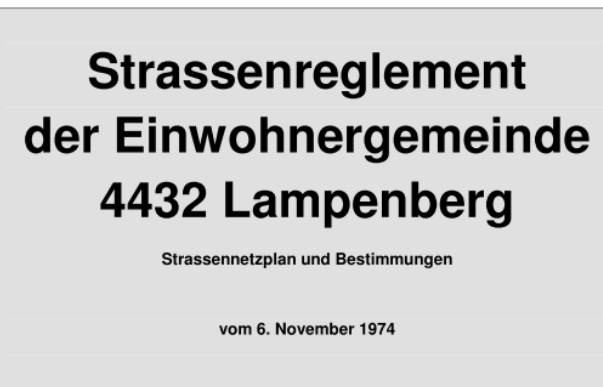
Titelblatt Strassenreglement vom 06. November 1974

Einwohnergemeinde Lampenberg Hauptstrasse 40 4432 Lampenberg ☎ 061/951 25 00 ☎ 061/953 90 31 ✉ gemeinde@lampenberg.ch Homepage: www.lampenberg.ch